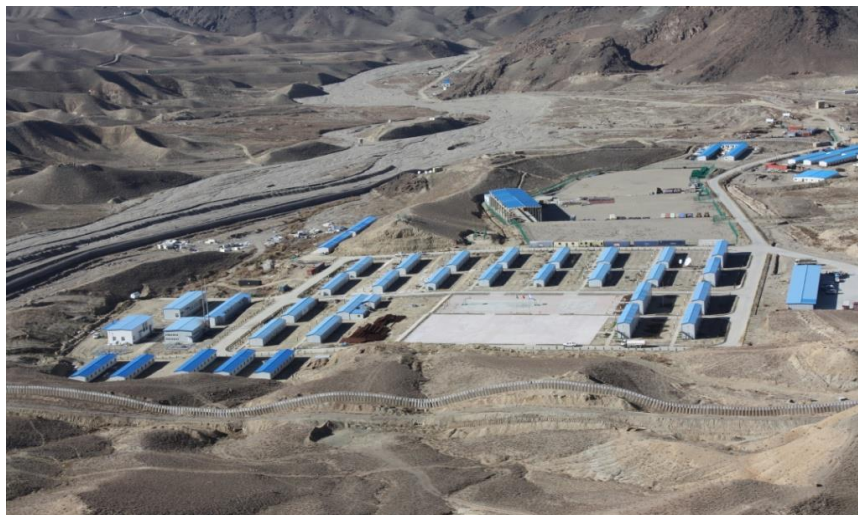
中冶江铜埃纳克铜矿项目营地

【承包劳务】据中国商务部统计，2018年中国企业在阿富汗新签承包工程合同7份，新签合同额47万美元，完成营业额4764万美元；累计派出各类劳务人员33人，年末在阿富汗劳务人员231人。