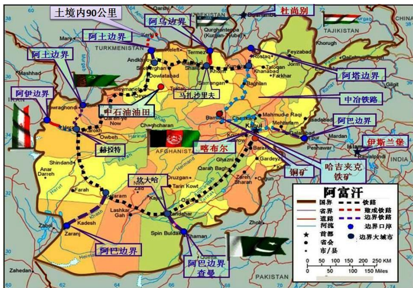
阿富汗铁路规划示意图（2011年）