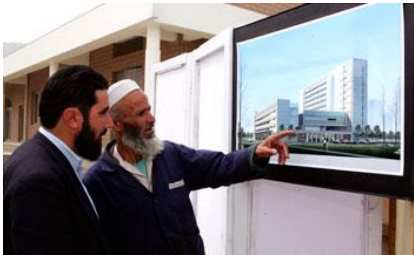
喀布尔共和国医院

阿富汗每年进口大约价值4亿美元的药品，其中约40%是通过非法渠道进口。阿富汗公共卫生部正在筹划建立国家医药公司，以进口合格药品并防止恶性竞争。同时，阿富汗公共卫生部也正计划在喀布尔、赫拉特、巴尔赫、楠格哈尔、霍斯特、坎大哈省等地成立药品和食品控制中心，以检测从国外进口的药品和食品质量。目前，阿富汗国内仅喀布尔有一家药品和食品控制中心。