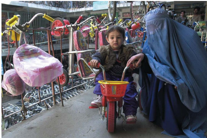
位于首都喀布尔的中国自行车城

【承包劳务】据中国商务部统计，2018年中国企业在阿富汗新签承包工程合同7份，新签合同额47万美元，完成营业额4764万美元；累计派出各类劳务人员33人，年末在阿富汗劳务人员231人。