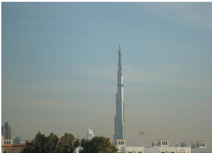
世界第一高楼——哈利法塔