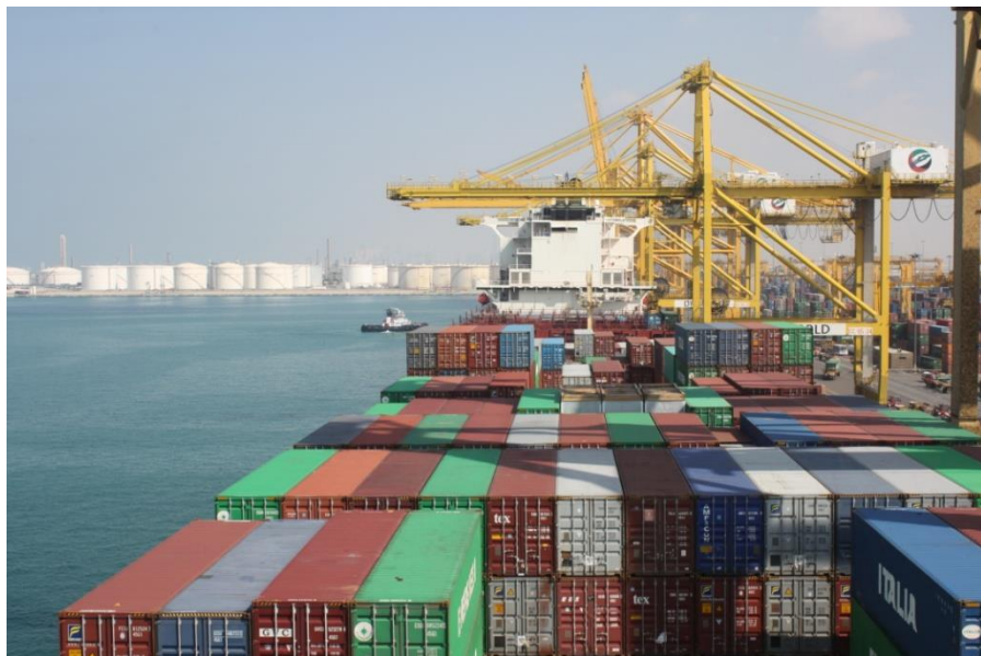
杰布阿里集装箱码头

哈里发港，为阿布扎比最大的商业港口，目前一期已完工。项目第一阶段包括具有年处理200万20英尺标准箱能力的港口和面积51平方公里的工业区A区。哈里发港已取代扎耶德港成为阿布扎比的主要货运港。目前，哈里发港口吞吐量为250万标箱和1200万吨一般货物。中远海运码头公司于2016年9月获得二期码头35年特许经营权2018年12月10日，中远海运港口阿布扎比码头正式开港。2019年5月，中远太阳轮和双鱼座轮两艘可载两万标箱以上的超大巨轮相继停靠中远海运阿布扎比码头。