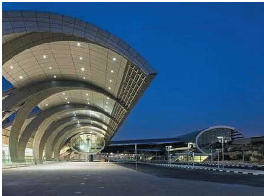
迪拜国际机场T3航站楼外景