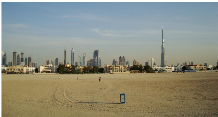
迪拜中央商务区远眺

阿联酋自然资源丰富，政局长期稳定，地理位置优越，基础设施发达，社会治安良好，商业环境宽松，经济开放度高，是海湾和中东地区最具投资吸引力的国家之一。其投资吸引力表现为一是低税率，一般货品仅收5%关税，5%增值税；二是港口物流便利，配套设施完善；三是一站式服务，网络化管理，服务快捷高效。尤其是国际金融危机和地区动荡爆发以来，阿联酋已经成为地区资金流、物流的避风港，其地区性贸易、金融、物流枢纽的地位进一步加强。据阿拉伯投资和出口信贷担保公司数据显示，2003-2016年间，阿联酋吸引外资项目4492个，占阿拉伯国家吸引外资项目总量的36.8%，据联合国贸发会议发布的2019年《世界投资报告》数据显示，2018年阿联酋吸引外资流量103.85亿美元，截至2018年末，阿联酋吸引外资存量1403.19亿美元。世界经济论坛《2019年全球竞争力报告》显示，阿联酋在全球最具竞争力的141个国家和地区中，排第25位。