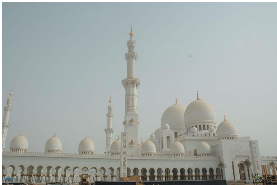
阿联酋最大清真寺—扎耶德清真寺

(5) 阿联酋人性格粗犷奔放，热情好客，习惯以茶和咖啡待客，格外喜爱甜点。客人落座后，端上来的除了茶、咖啡，还会有甜点、巧克力或椰枣。