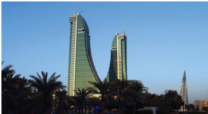
巴林金融港和世界贸易中心