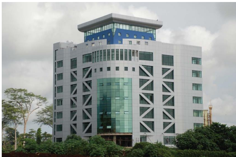
赤几总理府办公楼