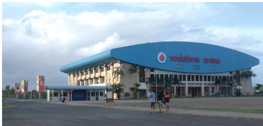
中国援建的多功能体育馆