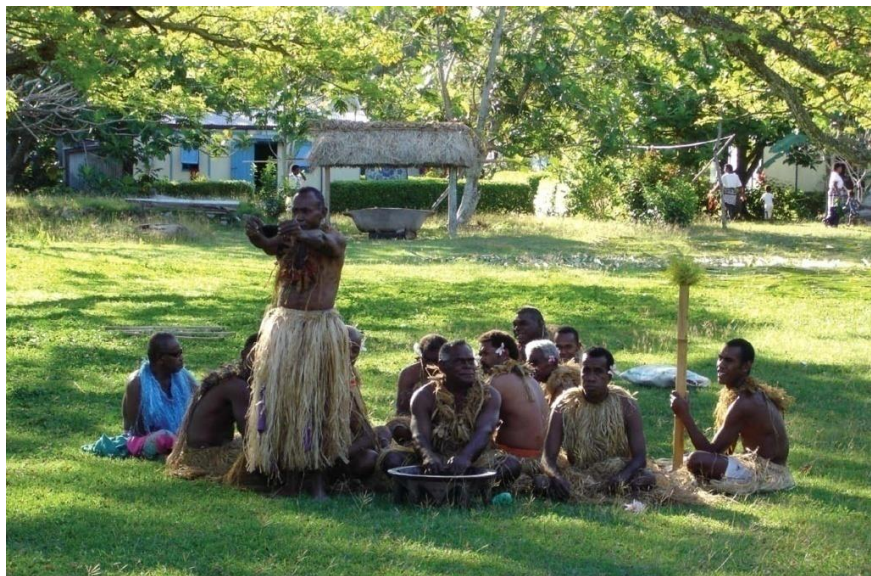
斐济敬献卡瓦仪式

【教育】斐济文教事业较南太其他岛国发达，公立小学实行免费教育。学龄儿童小学入学率达99%，中学入学率88%。2009年斐济共有注册学校983所，其中小学721所，中学172所，师范学校4所，技校69所。2010年1月，斐济国立大学成立。此外，由南太地区各国合办的南太平洋大学也坐落于苏瓦市。目前斐济共有在校大学生2.4万余名。2018/19财年，斐济教育预算约10亿斐元，占政府总预算支出的22%。