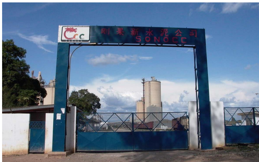
中国路桥与刚方合资年产30万吨刚果新水泥厂

【工业产业】近年来，刚果（布）工业增长平均达到8%，2017年工业产值约占国内生产总值的50.8%。