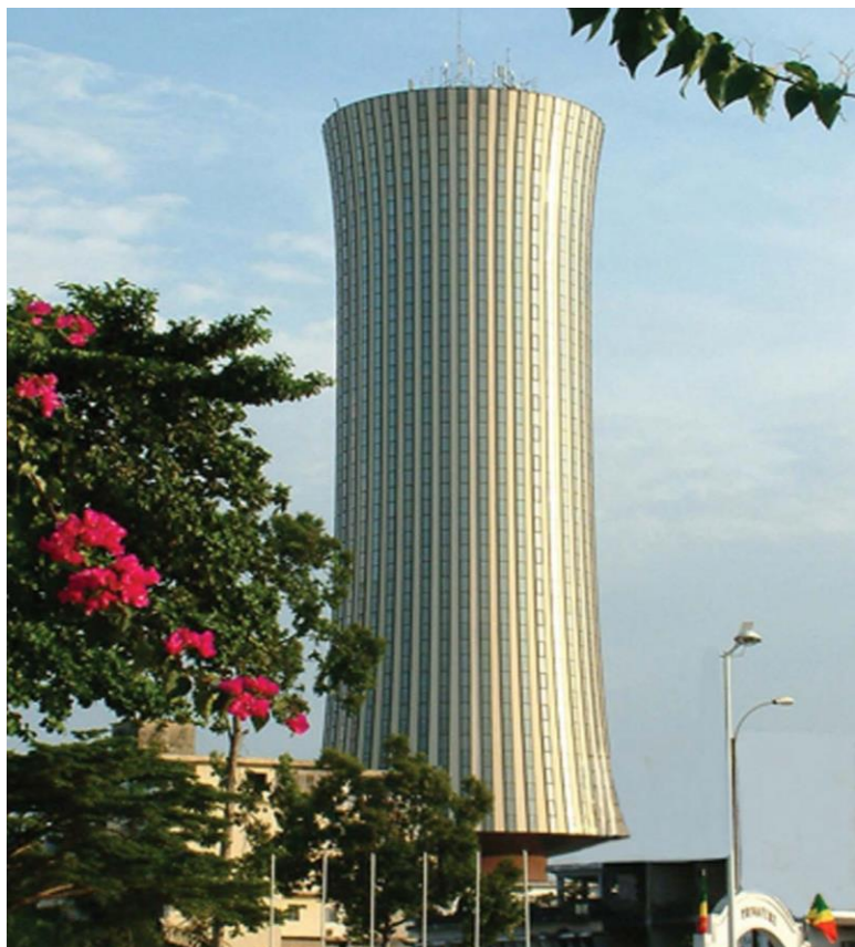
政府办公楼（当地俗称“腰鼓楼”）

渔业国务部，经济、工业和国库国务部，贸易、供应和消费国务部，内政和地方分权部，矿业和地质部，领土整治、装备和大型工程部，石油天然气部，外交、合作和海外侨民部，国防部，财政和预算部，新闻和媒体部，高等教育部，装备和道路养护部，初中等教育和扫盲部，司法、人权和土著民族促进部，中小企业、手工业和非正规部门部，能源和水利部，土地事务和公产管理负责与议会关系部，经济特区部，技术职业教育、专业技能培训 and 就业部，建设、城市规划和住房部，林业经济部，运输、民用航空和高船部，卫生和人口部，科研和技术创新部，计划、统计和区域一体化部，邮政、电信和数字经济部，旅游和环境部，体育和体育教育部，社会事务和人道主义行动部，妇女促进和参与发展部，青年与公民教育部，文化与艺术部，内政和地方分权部。