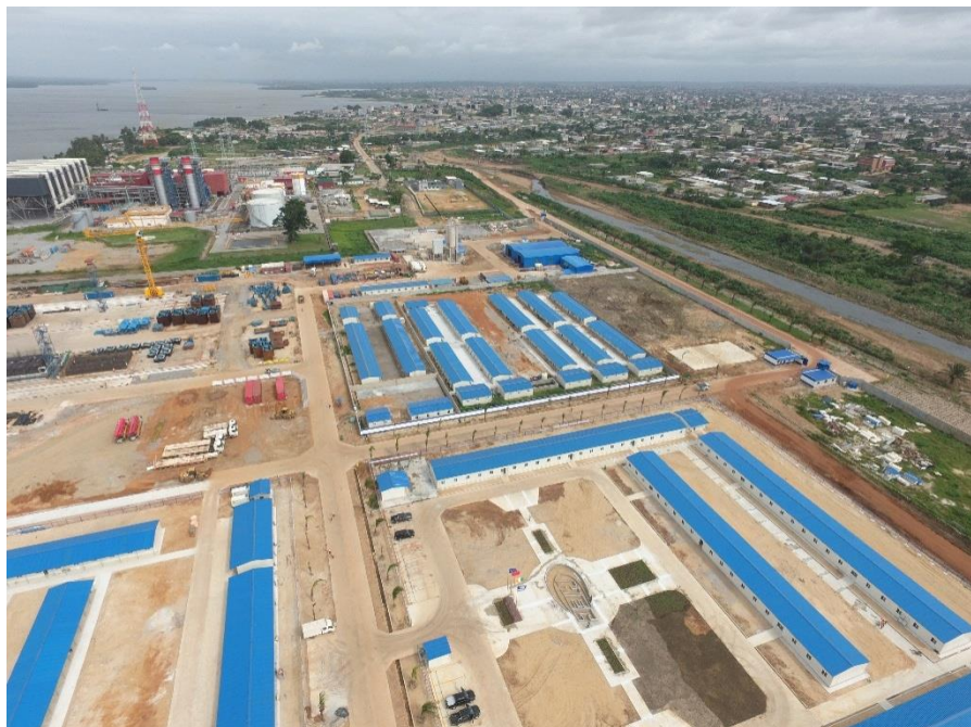
中国港湾项目现场