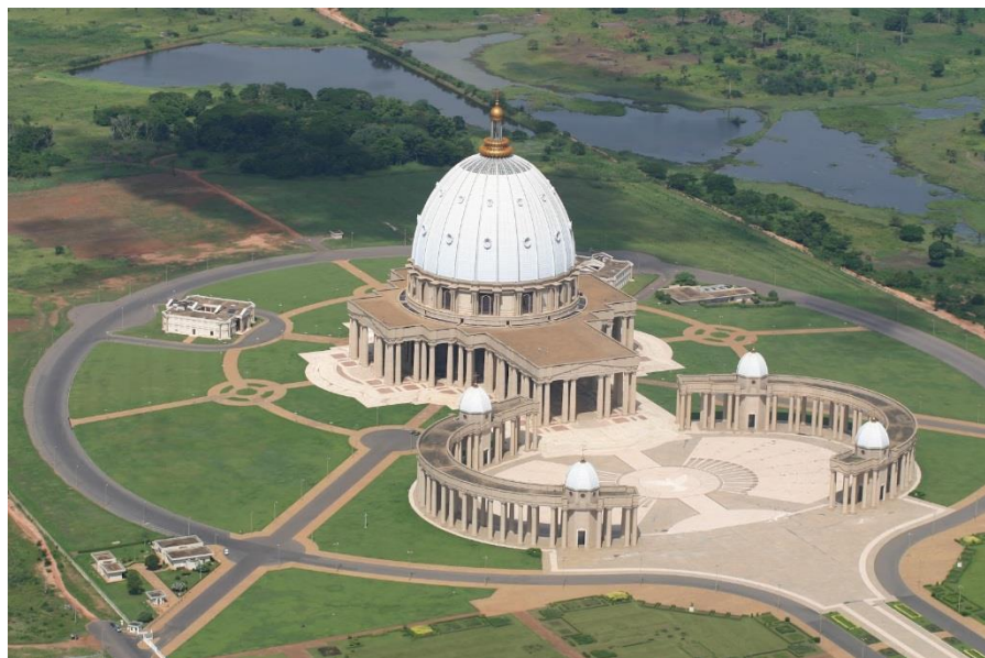
亚穆苏克罗大教堂

科特迪瓦42%的居民信奉伊斯兰教，34%信奉基督教，16.7%无宗教信仰，其余信奉原始宗教（拜物教）等。伊斯兰教集中在北部地区，基督教在南部，拜物教则遍及全国各地。