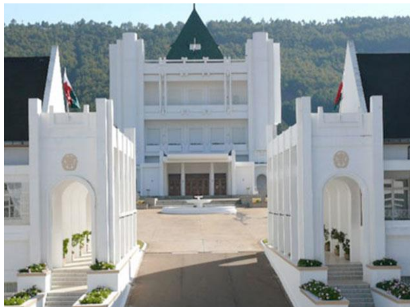
雅武麓总统府