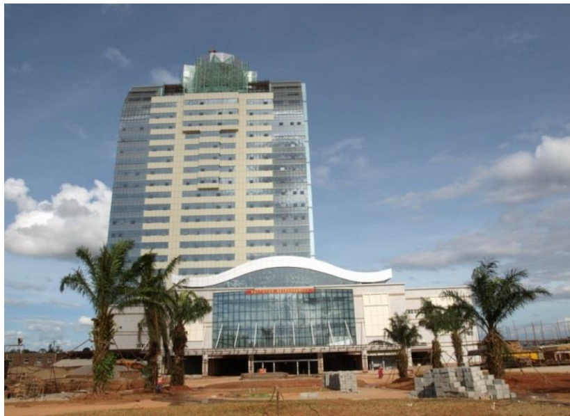
中国企业承建的五星级酒店