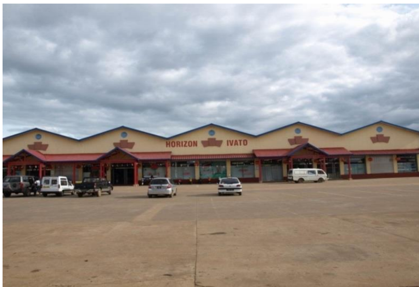
中资企业华安公司投资的亿万多 (IVATO) 超市