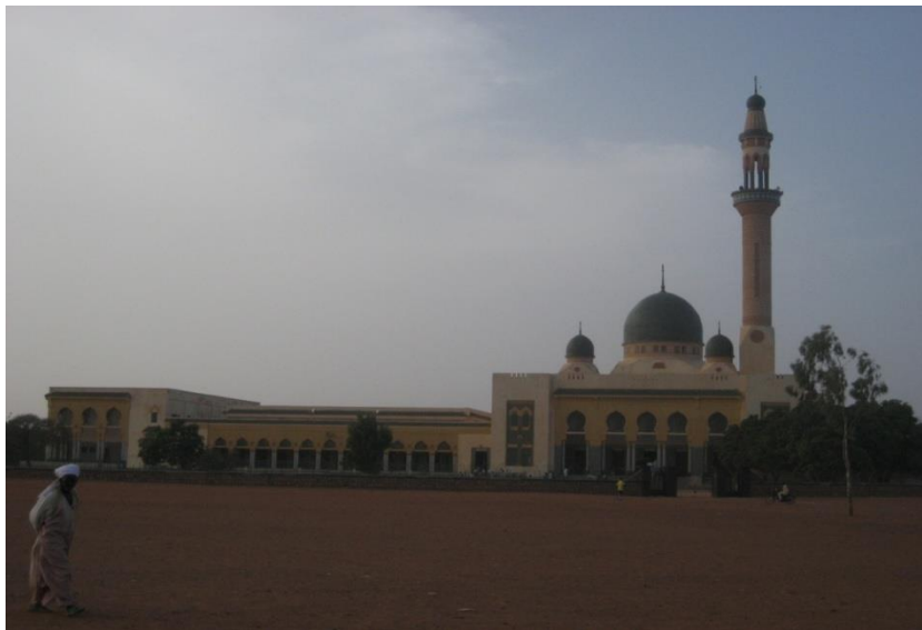
尼日尔最大的清真寺