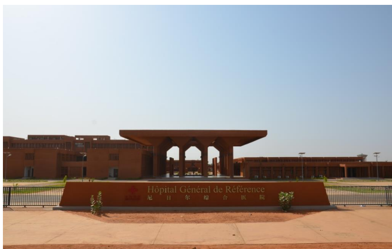
中国政府援建的尼日尔综合医院

【对尼援助】1974年至1992年间，中方援助了尼日尔农业合作、特腊水库、埃尔地区打井、农具车间改造、蒂亚吉埃尔下垦区、综合体育场、沼气、加亚垦区等项目。1996年中尼复交后，中国又完成恩东加节制闸工程、修复特腊水库部分设施、社会住宅建设、体育场馆维修、尼亚美大学教室和纺织印染厂扩建、津德尔市政供水工程等项目。2011年3月18日通车的尼亚美中尼友谊大桥是中国援西非地区较大项目之一，也是尼历史上最大项目之一。目前正在实施的有援尼日尔小学校项目、体育场技术合作和援尼日尔医疗队等项目，援尼日尔医疗队住房项目已于2015年12月完工，援尼500床位综合医院项目已于2016年8月竣工，2017年投入使用。