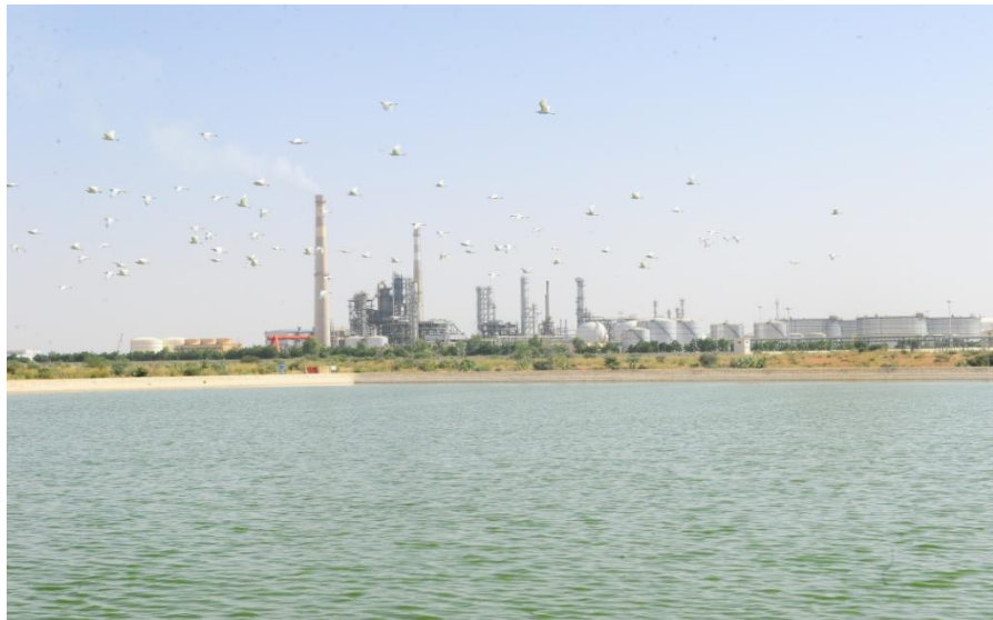
中尼合资津德尔炼厂

【工业】基础薄弱，结构单一，以炼油业为主。2018年工业产值13.2亿美元，占国内生产总值的14.9%。主要有石油化工、电力、纺织、采矿、农牧产品加工、食品、建筑和运输业等。全国现有58家中小型企业，其中实际运营的有43家。采矿业产值占国内生产总值的6-7%。有两家大型铀矿开采合营公司——阿伊尔矿业公司（SOMAIR）和阿库塔矿业公司（COMINAK），尼日尔政府分别占33%和31%的股份。中核投资的阿泽里克铀矿维持技术性停产，法国阿海珐公司开发的伊姆拉郎矿继续停建。