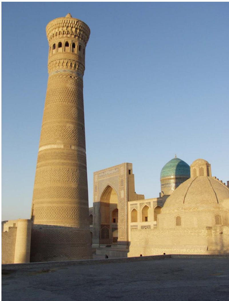
历史名城——布哈拉古迹