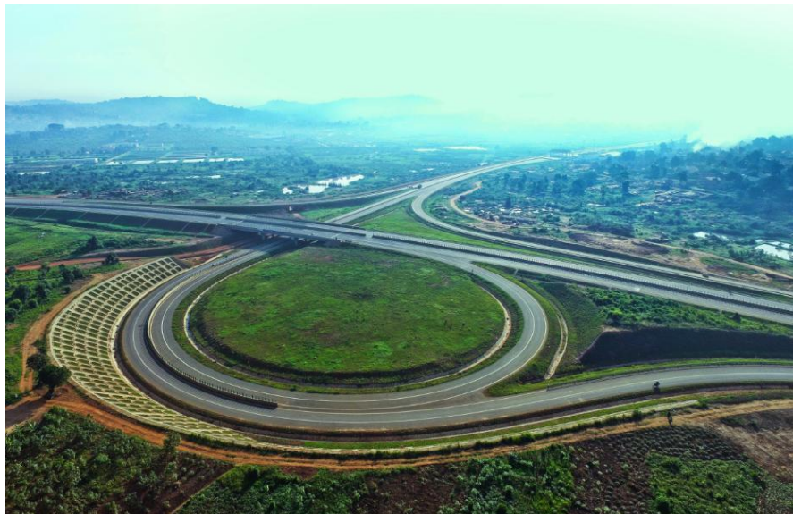
坎帕拉-恩德培机场高速路

近年来，乌干达多方筹措资金，利用世界银行和非洲开发银行贷款、西方国家援助资金以及自身财政收入，加大对公路建设方面的投入，改善现有国道路况。与国道不断改善相比，各城市道路包括首都坎帕拉的道路坑坑洼洼，状况较差。在各方的抱怨声中，2010年，乌干达中央政府将城市道路修建和维护的权利从各市政府收归中央政府，由国家公路管理局统一管理，以便改善城市道路状况。2012年，乌干达首都坎帕拉至恩德培高速公路开工建设，2018年6月正式通车，这是乌干达历史上的第一条高速公路。目前，乌干达共有近2000公里道路在建。按照乌干达公路局的规划，未来乌干达将修建 Tororo-Kamudini（340km）、Rwenkunya-Apac-Lira-Acholibur 公路及 Kampala-Jinja（77km）、Kampala-Mpigi（32km）、Kampala-Busunju-Kiboga-Hoima（200km）高速路等重大项目。