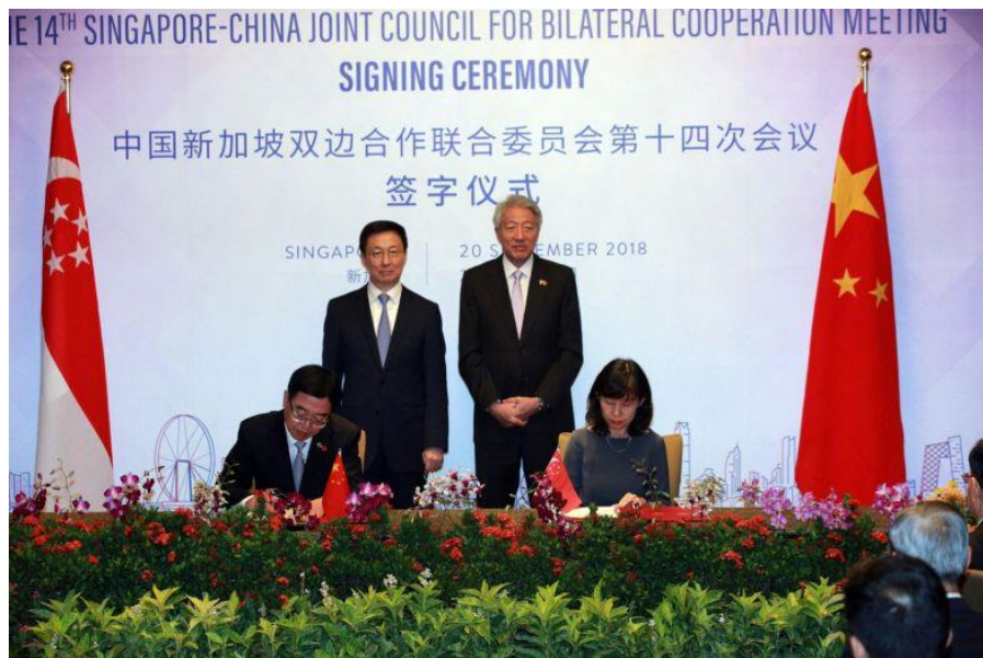
中新双边合作联委会第十四次会议签字仪式

【服务贸易】据中方统计，2017年双边服务贸易额239亿美元，其中中国对新加坡出口120.9亿美元，自新加坡进口118.1亿美元。中国对新加坡出口的主要服务类别为：运输占42%，贸易相关服务占12.2%，商业管理占10.5%，电讯、计算机信息服务占4.4%，其中占新加坡自全球进口份额较大的类别包括个人文化休闲服务、运输、建筑和保险，比重分别为7.2%、7%、5.6%和4.8%。中国自新加坡进口的主要服务类别为：运输占46.7%，金融占12.8%，保险占8.5%，商业管理占6.9%，其中占新对全球出口份额较大的类别包括保险、运输、知识产权、个人文化休闲服务，比重分别为11.7%、8.7%、6.2%和6.1%。中国是新加坡第四大服务贸易伙伴，新加坡是中国第九大服务贸易伙伴。