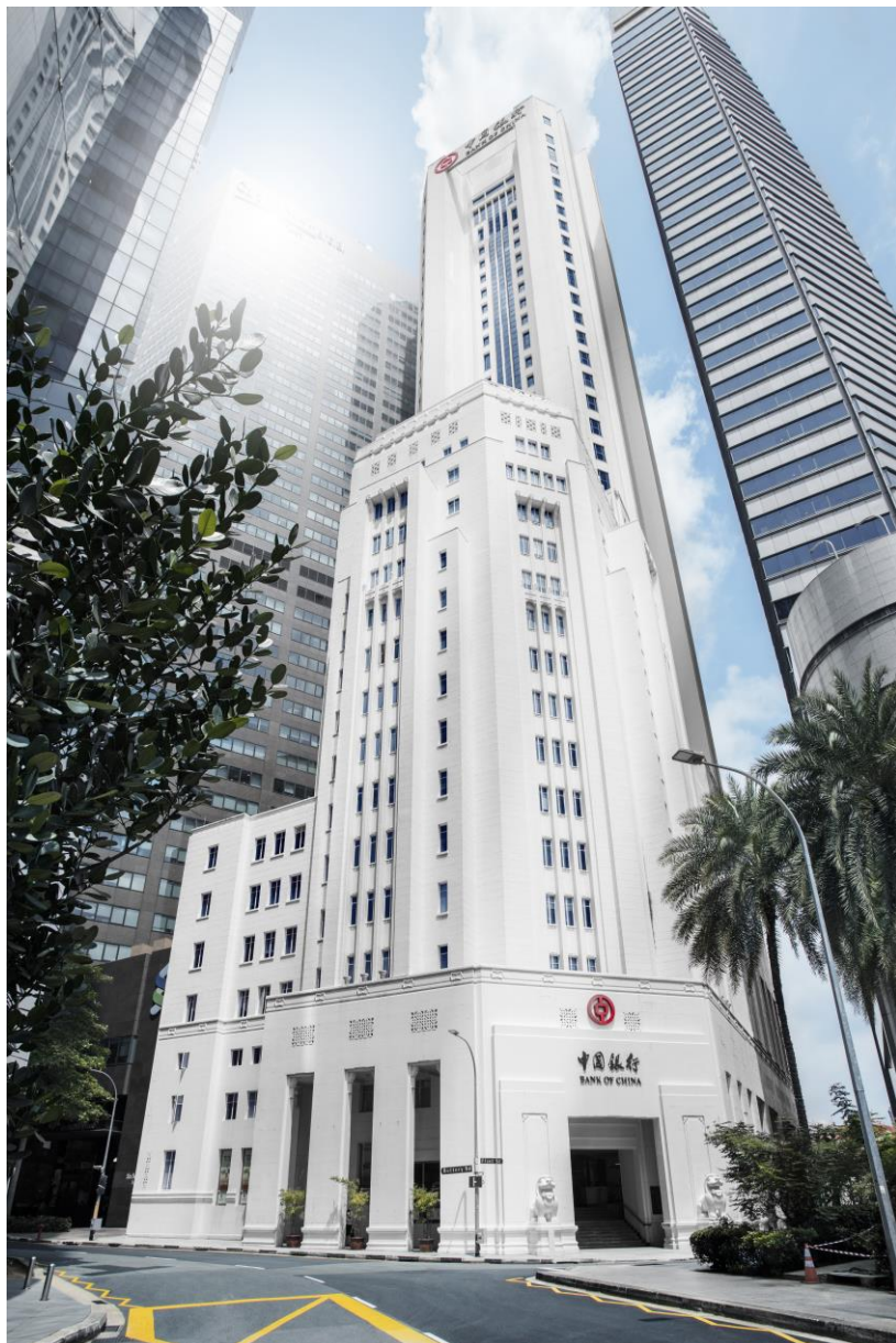
中国银行新加坡分行