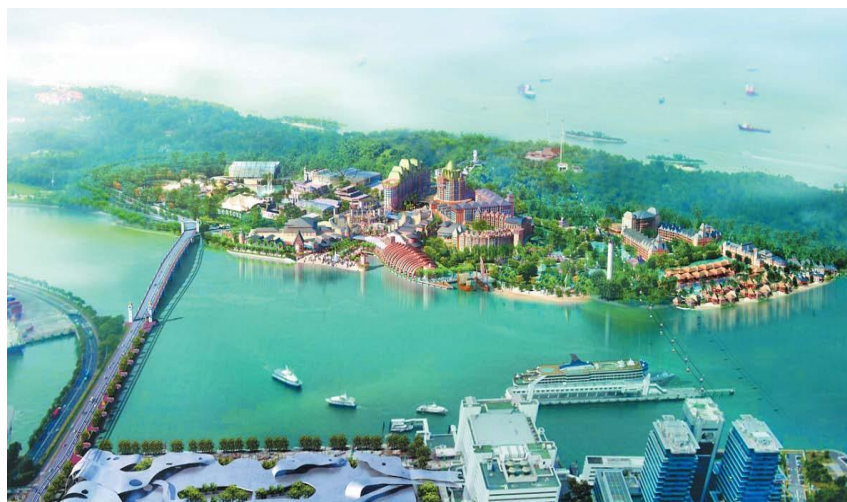
北京京冶工程有限公司承建的圣淘沙综合娱乐设施项目（部分）

【中国对新投资】据中国商务部统计，2018年当年中国对新加坡直接投资流量64.11亿美元。截至2018年末，中国对新加坡直接投资存量500.94