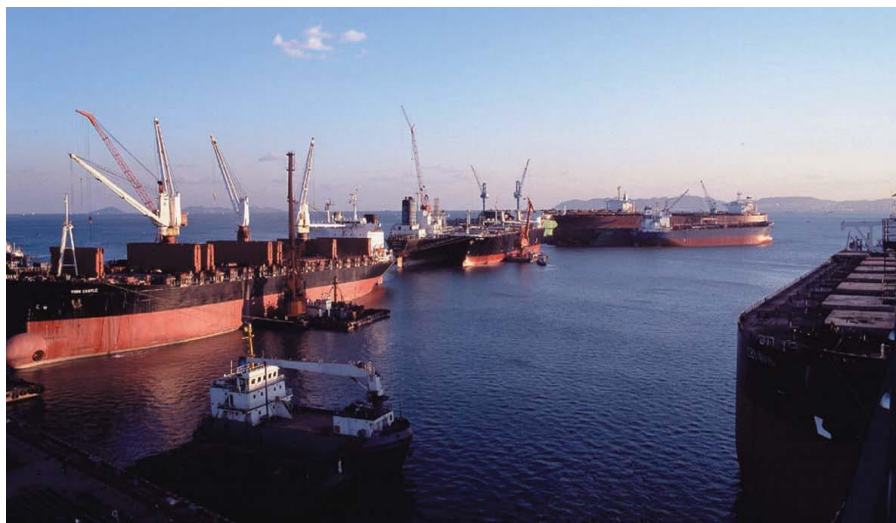
中资企业——中远投资（新加坡）有限公司

【货币互换】2013年3月，新加坡金融管理局与中国人民银行续签了双边本币互换协议，互换规模由原来的300亿新元（1500亿人民币）扩大至600亿新元（3000亿人民币）。新协议取代2010年7月23日签署的双边本币互换协议，旧协议自新协议签订之日起失效。新协议为期3年，经双方同意可以延长。2016年，中国人民银行与新加坡金管局续签了双边本币互换协议，有效期3年，互换规模维持在3000亿元人民币不变，自2016年3月7日起生效。2019年5月，中国人民银行与新加坡金融管理局续签了双边本币互换协议，协议规模为3000亿元人民币/610亿新加坡元，协议有效期3年，经双方同意可以展期。