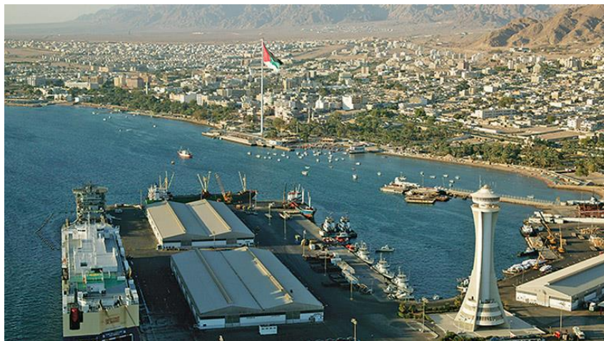
约旦亚喀巴集装箱港口

亚喀巴港是约旦唯一的港口，也是进出口贸易集散中心，拥有集装箱码头和散装码头，设置31个深水泊位，固定航线29条。港口配套有酒店、医院、购物中心等设施。根据约旦货运联盟数据，2018年，亚喀巴港口货物吞吐量为1612.48万吨，接待游客41.77万人次。