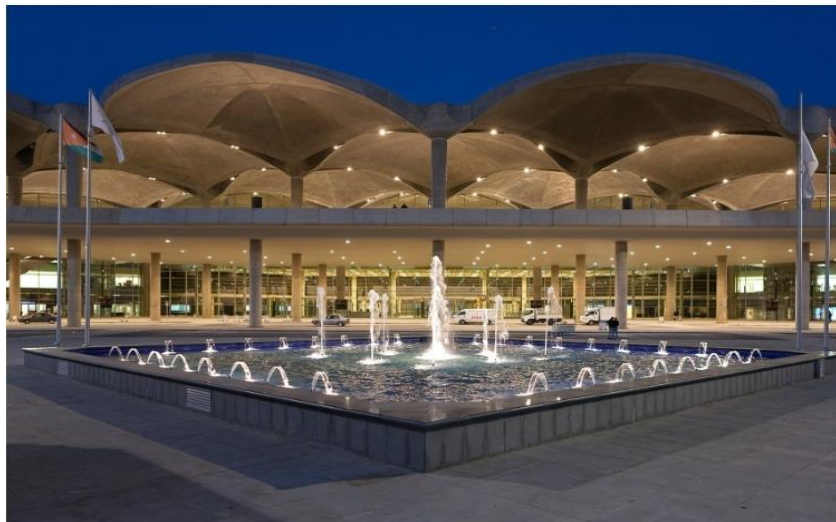
约旦安曼阿丽娅王后国际机场