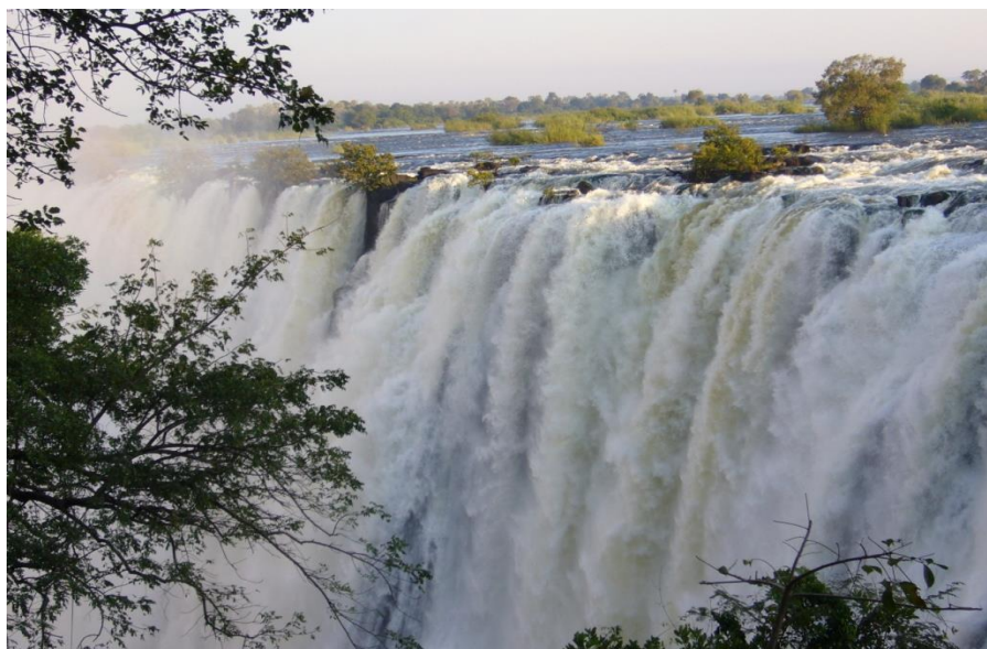
利文斯顿维多利亚瀑布

【建筑业】近年来，道路、机场、水电站以及超市等房建项目陆续开工，拉动了赞比亚建筑业的迅速发展。